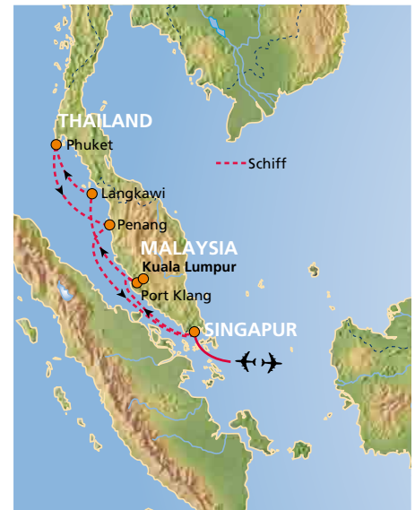
Route Mein Schiff 1